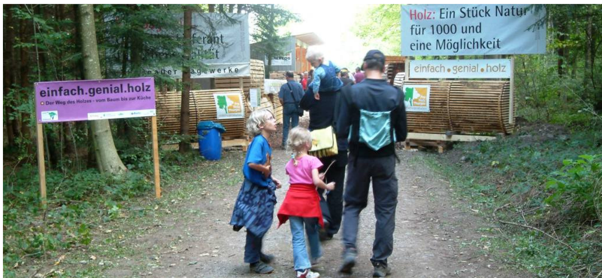
Besucher aller Altersgruppen genossen den informativen Waldrundgang in Frauenfeld. Der Stand der ProHolz Thurgau.

Ich war bei diesem Anlass aktiv bei der Organisation und der Durchführung dabei. So gestaltete ich über die ProHolz Thurgau die Auftritte „moderne Wärme aus Holz“ und „einfach.genial.holz“. Unsere Mitarbeiter halfen, wie die meisten Thurgauer Forstreviere, ebenfalls bei den Waldtagen mit.