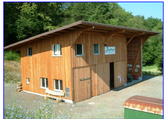
⇒ Forstthof der ThurForst